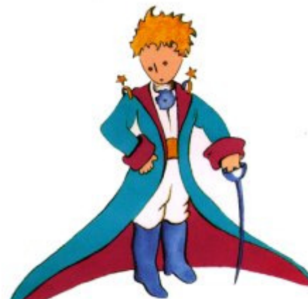
Aquí tienen el mejor retrato que más tarde logré hacer de él

Me puse en pie de un salto como herido por el rayo. Me froté los ojos. Miré a mi alrededor. Vi a un extraordinario muchachito que me miraba gravemente. Ahí tienen el mejor retrato que más tarde logré hacer de él, aunque mi dibujo, ciertamente es menos encantador que el modelo. Pero no es mía la culpa. Las personas mayores me desanimaron de mi carrera de pintor a la edad de seis años y no había aprendido a dibujar otra cosa que boas cerradas y boas abiertas.